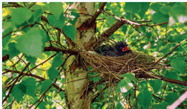
Käopoeg karminleevikese pesas.

Eestis on kägu üldtuntud ja väga levinud liik, keda meie maastikel elab ligikaudu 100 000 isendit. Eestis pesitseb kägu väga erinevat tüüpi hõredamas metsas, kaldavõsastikus, puissoos, aga näiteks ka puisniidul. Laia elupaigavalikut võimaldab tõik, et Läänemere-maade käod munevad väga erinevate sulasliikide pesadesse. Siiski ei pesitse kägu linnades ja mujal tihedama inimasustusega alal ning on suhteliselt väikesearvuline ka tihedas liigendamata metsalaamas. Euroopas arvatakse elavat 12,6–25,8 miljonit kägu, ta on kahaneva arvukusega liik.