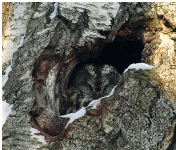
Varjevärvusega kodukakk puuõõnsuses.

Kõige tüüpilisem kodukaku hüüe on kõlav ja kaugele kostev huu-uh-uh-uh-huuuu . Sageli, eriti pesapaiga läheduses, võib kuulda ka õõnsat hääletsust kuvitt, kuvitt , mida teeb sagedamini emaslind. Pesast väljalennanud pojad häälitsevad manguvalt psee-ep, psee-ep . Selliseid poegade hääletsusi võib kuulda maist juulini.