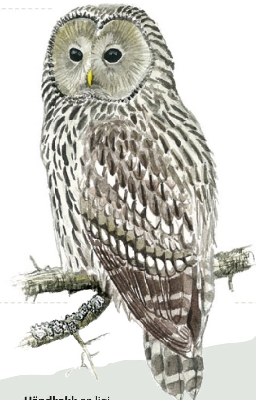
Händkakk on ligi kolmandiku võrra suurem ja pikema sabaga kui kodukakk.