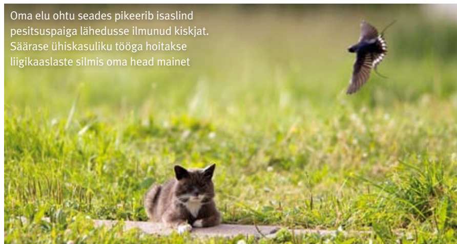
Oma elu ohtu seades pikeerib isalind pesitsuspaiga lähedusse ilmunud kiskjat. Säärase ühiskasuliku tööga hoitakse liigikaaslaste silmis oma head mainet